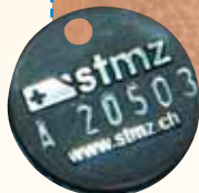
Nebst Chip und ANIS- oder STMZ-Marke: Mit einem Peilsenderhalsband kann man ein eingesperrtes oder verletztes Tier selber schnell wieder finden.